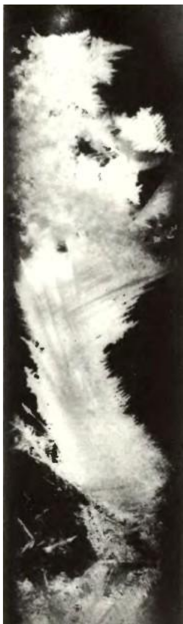
Дендриты, наблюдавшиеся в ампуле-штормгласе 8 марта 1979 года.

Затем я прикрыл некоторые из этих ампул колпачками из латунной сетки и заметил, что, в то время как в неэкранированных трубках кристаллы энергично поднимались на несколько сантиметров, в трубках, защищенных экраном, кристаллы или не росли вовсе, или вырастали всего на несколько миллиметров.